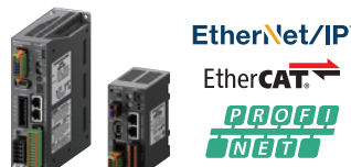
Controlador de Eje Único

Compatible con comunicaciones (Alimentación CC)